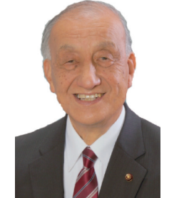
金剛寺龍ヶ崎市議