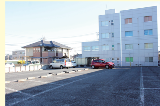
ビルの裏手に660㎡(200坪)の駐車場