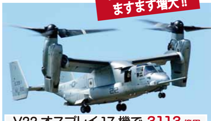
V22 オスプレイ 17機で 3113億円 2014～18年度に計上した費用の一部