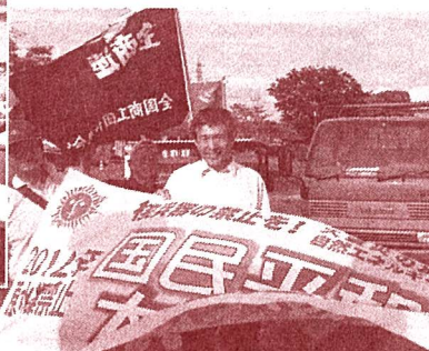
国民平和大行進の先頭に(写真中央) =6月30日、常陸太田市