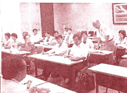
放射能から子どもを守る健康調査 実施を知事に申入れ (写真前列右端) =8月10日、県庁