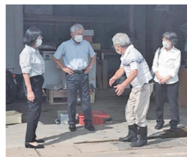
床上浸水の被災者を訪問