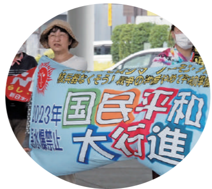
広島・長崎への平和行進に毎年参加