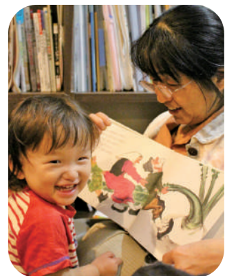
孫に絵本を読み聞かせ