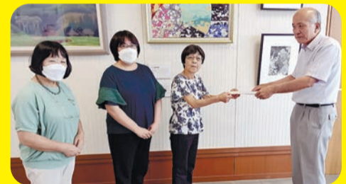
●値上げ撤回を市に申し入れ (2024年8月6日)