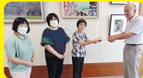
●値上げ撤回を市に申し入れ (2024年8月6日)