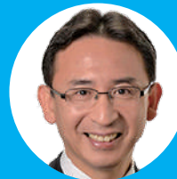
衆院議員 塩川鉄也 党国会対策委員長代理