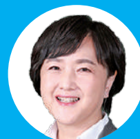
元衆院議員 梅村さえこ 党子どもの権利委員会 責任者