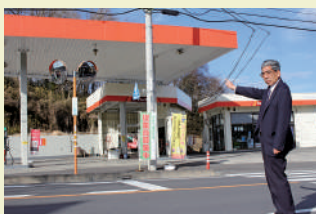
エネオス大子壩SS前交差点に信号設置を求めます