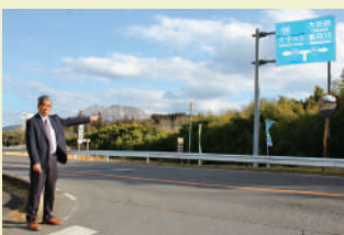
国道461号・田野沢入口丁字路に信号設置を求めます