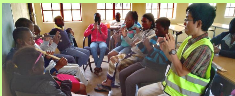
リコーダー演奏はみんな大好き