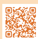
日本共産党の外交ビジョン▲

ガザ・ウクライナの即時停戦を。日本共産党は「海外で戦争する国」づくりでなくあらゆる紛争を平和的な話し合いで解決し、平和的に共存する道、憲法9条にもとづく平和外交をよびかけています。