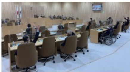
処分場受け入れ決議を可決した本会議=21年6月、日立市議会