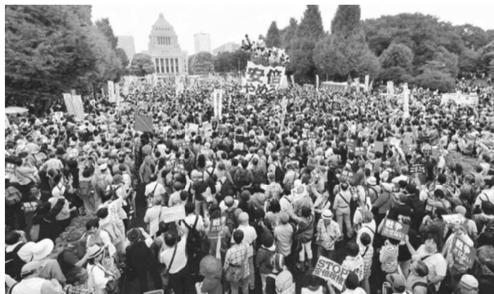
12万人が参加した「戦争法案反対・安倍内閣退陣 8.30国会前大行動」