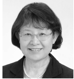
日本共産党・市議