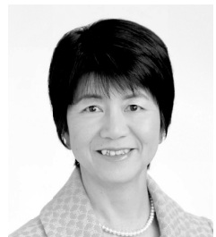
日本共産党・市議予定候補