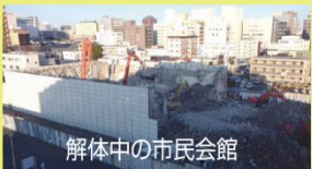
解体中の市民会館